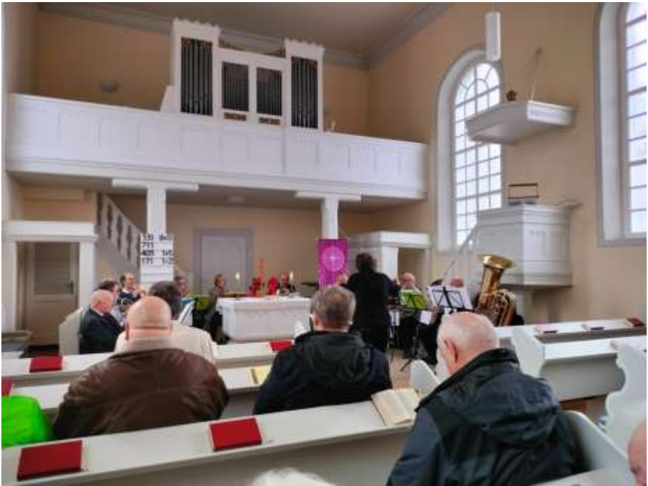
Bild vom gemeinsamen Gottesdienst in Sitters mit Posaunenchor des CVJM Matthäuskirche und Liebenzeller Gemeinde aus Bad Kreuznach

Im Januar und Februar erlebten wir besondere Gottesdienste: dazu kamen Menschen aus den verschiedenen Orten unserer Pfarrei an einem Ort zusammen, feierten gemeinsam Gottesdienst und hatten im Anschluss noch bei Kaffee oder Glühwein Zeit zum Gespräch, zum Austausch, zum Miteinander. Für mich eine wunderbare Erfahrung, die bleibt.